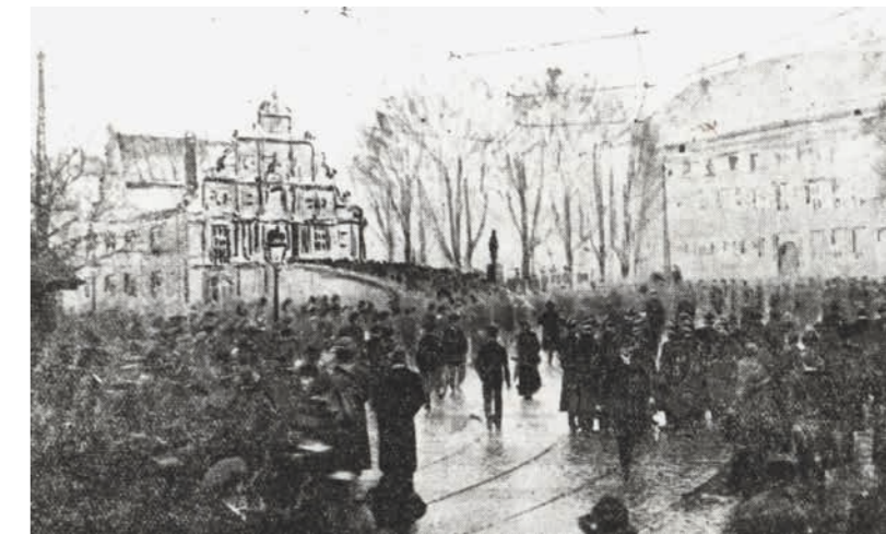
Det eneste eksisterende foto fra stormen på Børsen.