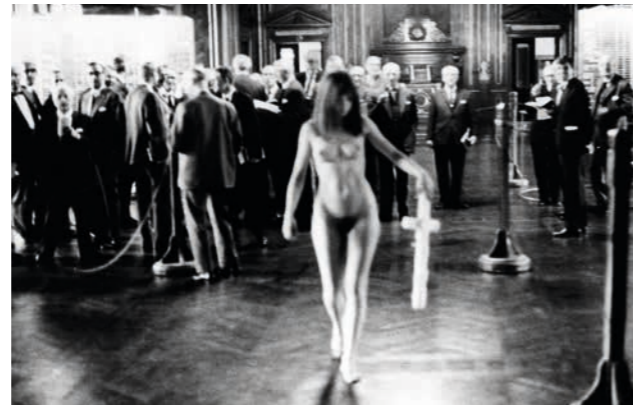
Lene Adler Petersen og Bjørn Nørgaard: Uddrivelsen af templet/Nøgen kvindelig Kristus I.

Det var en tidstypisk, men i Børsens verden dybt chokerende hændelse, da Bjørn Nørgaard og Lene Adler Petersen udførte deres happening i 1969, hvor hun vandrede nøgen gennem Børsen, befolket med finansmænd, bærende på et stort kors, som Jesus da han uddrev kræmmerne fra templet. Få år efter, i 1974, ophørte Københavns Fondsbørs' virke i bygningen og flyttede over vandet til Nikolaj Plads.