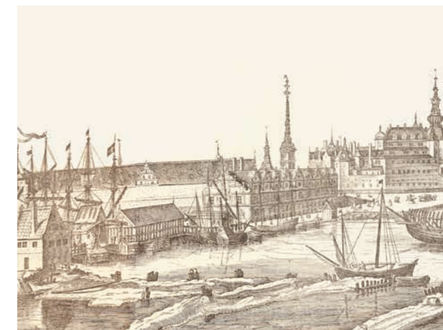
Prospekt med Børsen, da man kunne sejle ind fra begge sider. Kopi af kobberstik ca. 1650 efter forlæg fra 1620'erne.

Børsen lå og ligger i det hele taget tæt på demokratiets hotspots, Folketinget og slotspladsen, som især siden 1870'erne med industrialiseringen, arbejdsmarkedet og den parlamentariske udvikling blev et stadig stærkere brændpunkt for det offentlige samspil mellem politik, økonomi og kultur.