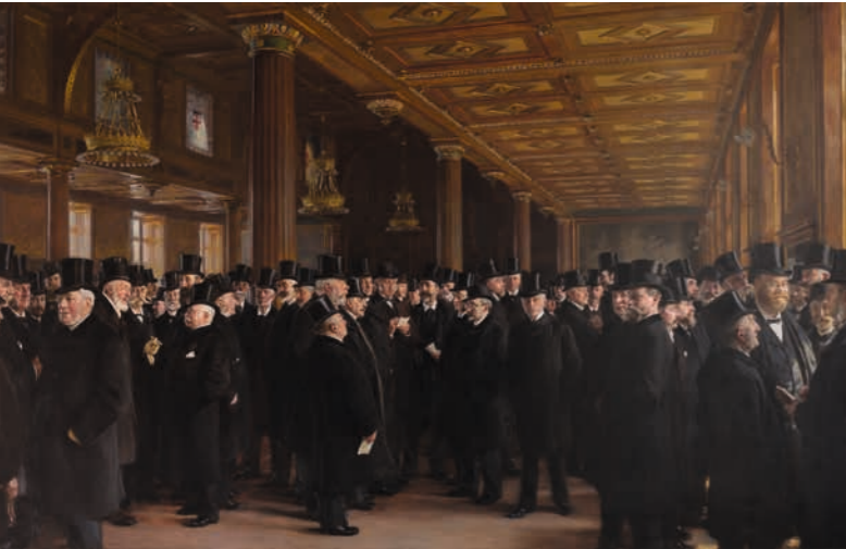
P.S. Krøyer: Fra Københavns Børs

En af de hændelser, der har virket stærkest og voldsomt gennem tiden er nok Stormen på Børsen i 1918. Både pga. hvad der skete og fordi det skete i den tid og den sammenhæng, det gjorde.